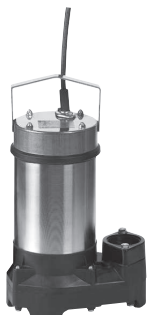
Wilo-Drain TS 40